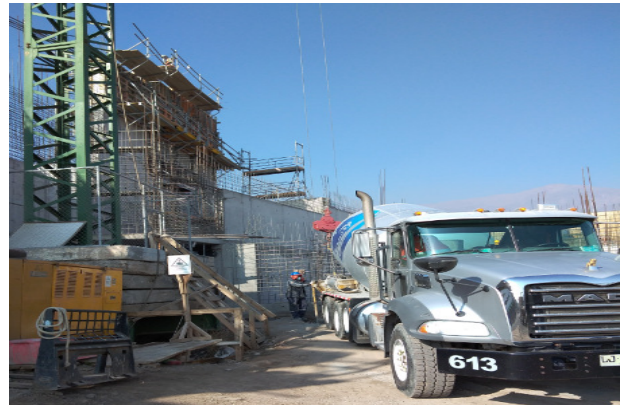
Hormigonado de núcleo muros ejes W-T-U2, piso 2, etapa 4, coronamiento, sector coro, templo mayor.