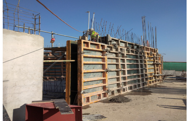
Hormigonado de muro eje 6/Y-Y1, piso 1, Templo menor.