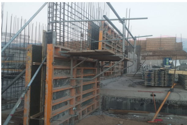
Hormigonado de muro eje Y1/8-11, piso 1, Templo menor.