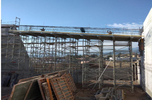
Avance armadura viga eje R/4-5, cielo templo mayor.