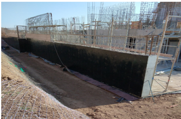
Imprimación muro eje 17/C-Y1, nivel 2.