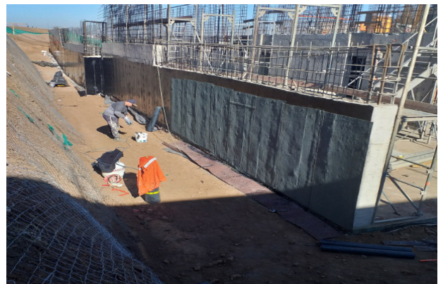
Instalación de membrana asfáltica muro eje 17/C-H1, nivel 2.