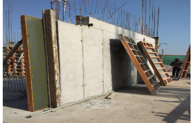
Descimbre muro eje 6/Y-Y1, piso 1, Templo menor.