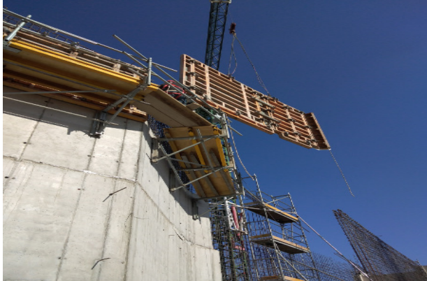
Instalación de moldaje 2° cara, núcleo muros ejes W-T-U2, piso 2, etapa 4, coronamiento, sector coro, templo mayor.