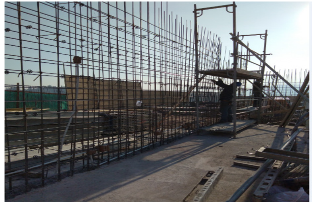
Avance armadura muro eje Y1/8-11, piso 1, templo menor.