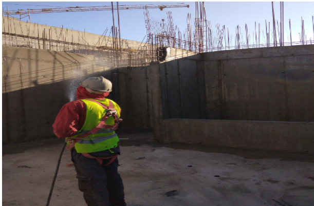
Curado por riego, muros ejes 6-13-14-L1-M-Y-Y1, piso 1, sector velatorios y templo menor