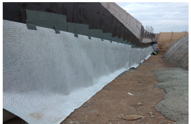
Instalación de Danodren en muro contra terreno eje 17/Y1-H1, nivel 2, sector rampa vehicular.